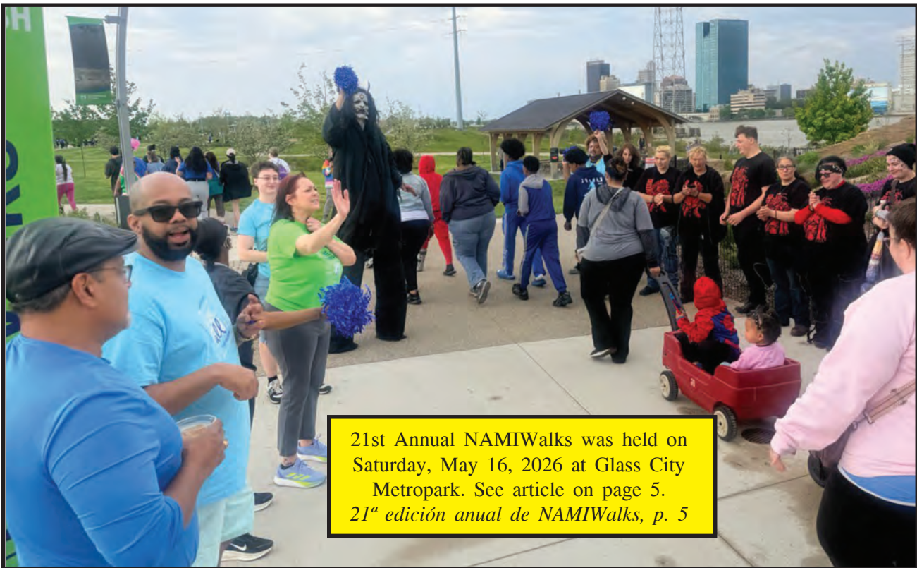
21st Annual NAMIWalks was held on Saturday, May 16, 2026 at Glass City Metropark. See article on page 5. 21ª edición anual de NAMIWalks, p. 5